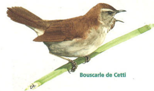
Bouscarle de Cetti

Ce site est aménagé par le Conseil général avec le produit de la Taxe Départementale des Espaces Naturels Sensibles, ainsi qu'avec l'aide financière de l'Union européenne et de l'Agence de l'eau Seine-Normandie. Sa gestion est assurée par le Conservatoire départemental des Espaces Naturels Sensibles en partenariat avec la commune dans le cadre d'une convention.