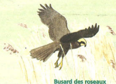
Busard des roseaux

Inextricables et hautes de plus de 2 mètres, ces formations végétales se composent quasi-exclusivement de roseaux (appelés aussi phragmites). Elles colonisent les sols les plus humides mais ont tendance à régresser face aux saules dont la croissance est rapide. Dans les secteurs les moins denses, la Grande Douve fleurit durant l'été. Ne la cueillez pas, cette plante est rare et protégée sur l'ensemble du territoire national !